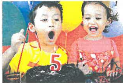
Liu fyller år den 14:e (fjortonde) maj.