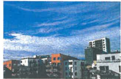
Anja bor på den 4:e (fjärde) våningen.

Ordningstal kan man skriva med ett ord eller som ett tal. Talet avslutar man med ett kolon och den sista bokstaven i ordet.